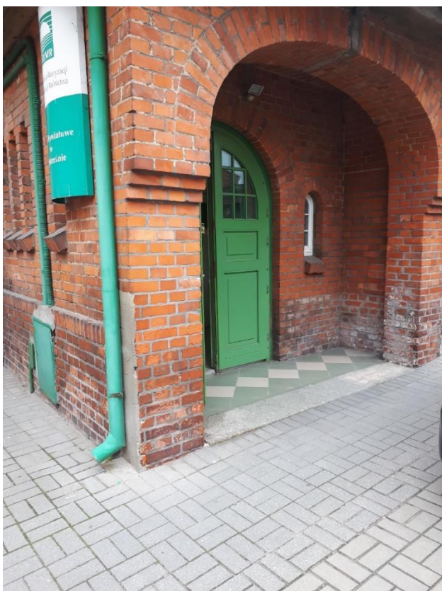
Wejście od strony parkingu (dla pracowników)